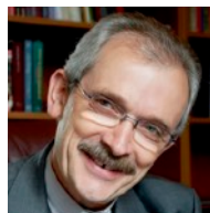
François FONLUPT Évêque de Rodez

En position de responsabilité, le service rendu peut renvoyer à une image de pouvoir. Comment gérer cette ambivalence, dans l'institution comme dans la vie ?